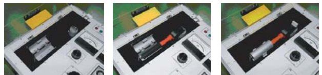
試験ボックス開閉状態 高圧検電器(伸縮式HSS-6B)試験の例