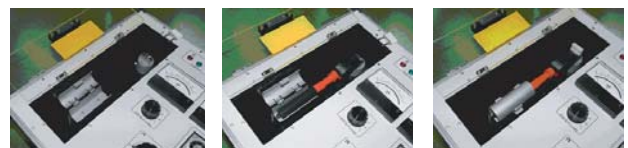
試験ボックス開閉状態 高圧検電器(伸縮式HSS-6B)試験の例